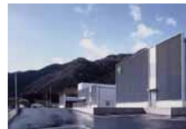
エイチビィアイ株式会社

本社・工場 兵庫県宍粟市山崎町上比地 650-1 TEL 0790-64-1201(代) 営業本部 大阪府豊中市新千里東町 1-4-2 千里ライフサイエンスセンタービル 1 1 階 TEL 06-6155-2212 東京営業所 東京都千代田区神田 3-5-5 大同ビル 4 階 TEL 03-5294-1561 舞鶴工場 京都府舞鶴市大波下 20-3 TEL 0773-63-8530(代)