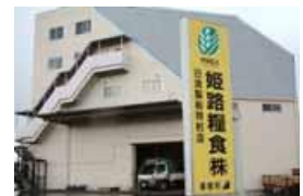
姫路糧食株式会社