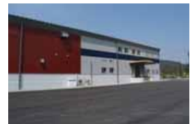
サン工業株式会社

本社・工場 兵庫県宍粟市山崎町川戸 1792-1 TEL 0790-63-2166