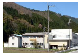
株式会社長田一宮

本社・工場 兵庫県宍粟市一宮町横山 389 TEL 0790-74-0205(代)